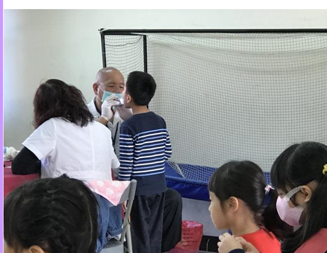
張大嘴巴，檢查一下有沒有蛀牙