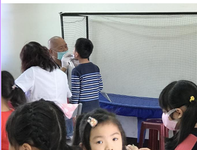
學生健康檢查由牙醫師仔細檢查