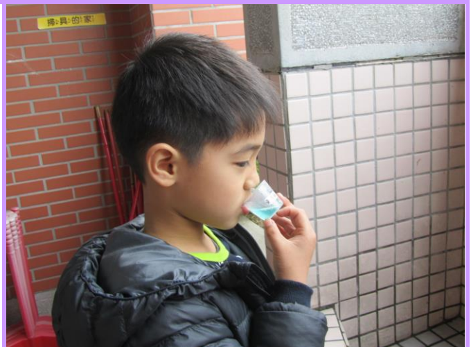
餐後用專屬小牙杯含氟在口中漱漱口