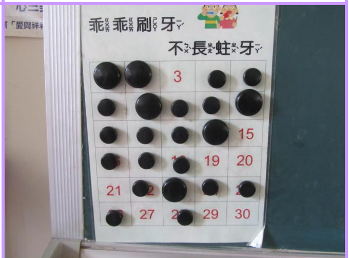
教室黑板設置潔牙完成登錄表格